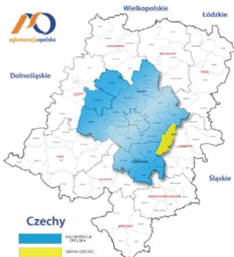
Ryc.2. Zasięg obszarowy Stowarzyszenia Aglomeracja Opolska

Aglomeracja Opolska to zurbanizowany obszar leżący w centrum województwa opolskiego. Skupia duży potencjał społeczny i ekonomiczny, oraz charakteryzuje się unikatowymi walorami przyrodniczymi i kulturowymi. Jego centrum stanowi Opole – stolica województwa, otoczone grupą mniejszych miast i wsi.