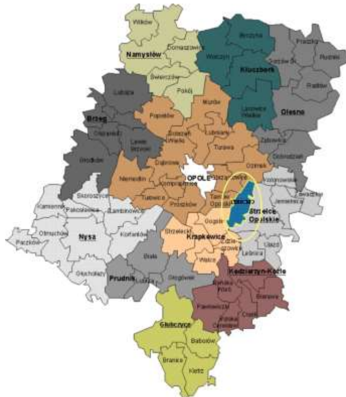
Ryc.1 Położenie gminy w obszarze województwa opolskiego

Gmina Izbicko położona jest w centralnej części województwa opolskiego w powiecie Strzeleckim w sąsiedztwie aglomeracji przemysłowej i wojewódzkiego ośrodka – m. Opola (Opole – 18 km; Strzelce Opolskie – 13 km; Krapkowitz – 20 km). Z wszystkimi wymienionymi ośrodkami ma dobre połączenie komunikacyjne poprzez drogę krajową (E-40) i drogi powiatowe.