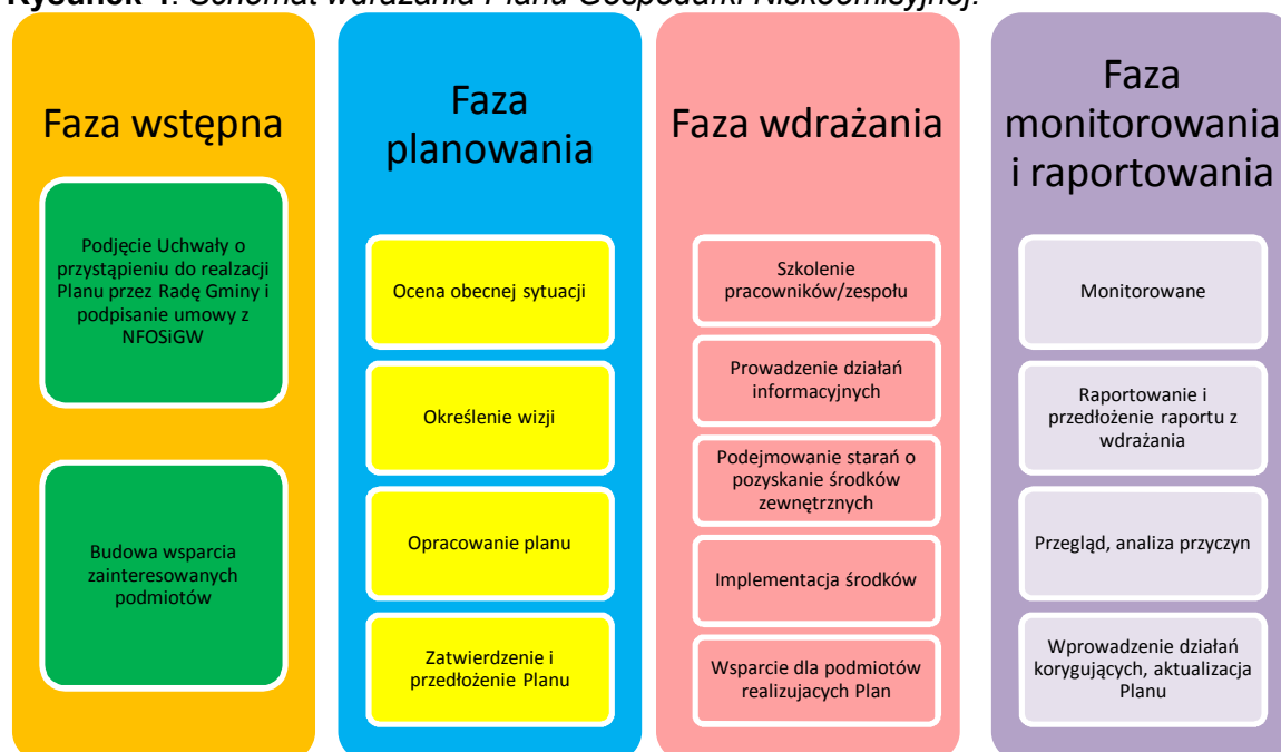
Rysunek 4. Schemat wdrażania Planu Gospodarki Niskoemisyjnej.

Schemat wdrażania Planu przedstawia rysunek poniżej: