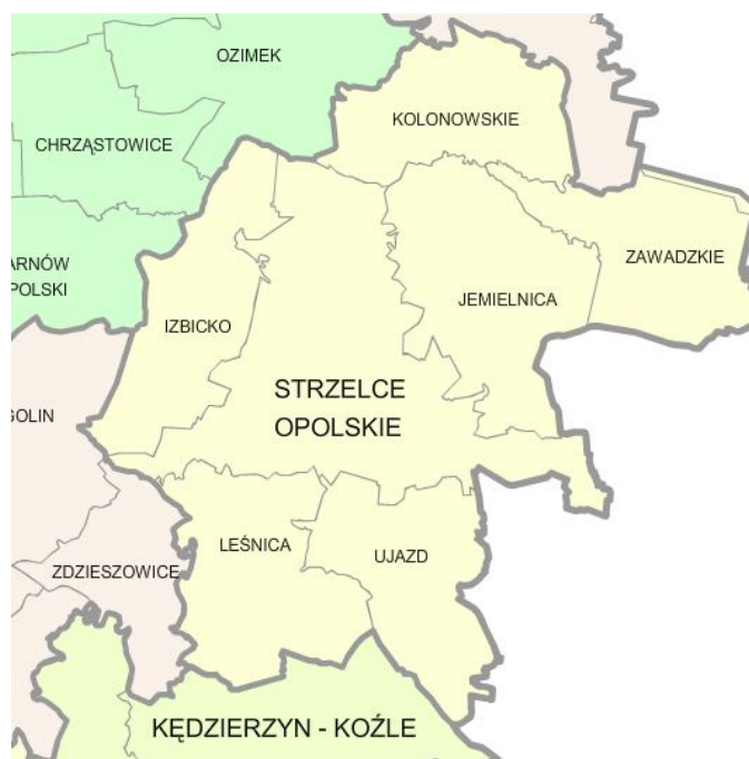
Rysunek 1. Położenie Gminy Izbicko w Powiecie Strzeleckim.